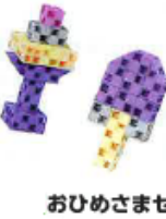
おひめさまセット