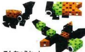
こんちゅうセット