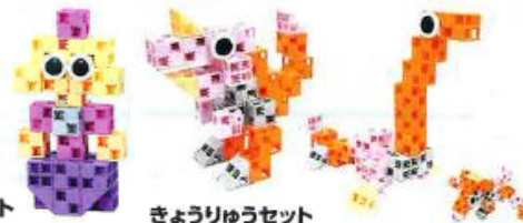
きょうりゅうセット

2回目はメインテーマであるロープウェイの組み立てから、どのようなしくみで動いているかまで本物と同じ動きを再現して実際に動かしてたしかめてみよう。