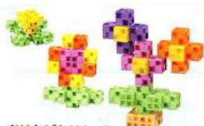
おはなばたけセット

2日間の短期集中講座になっていて1回目はブロックを組み立てることを学んでいくよ。下のブロックセットから好きなものを1つ選んでね！