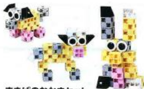
まきばのなかまセット