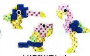
とりのなかまセット